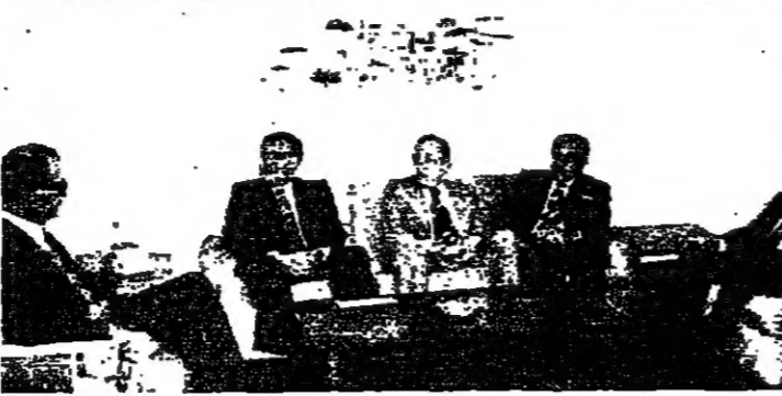
لقاء الحص مع وفد غرفة بيروت

لديه قبل الاحداث 3 هبط مدتها حوالي 2 الف قط في الوقت الراه رغم التنازلات الموجهة من قبل ادارة الصندوق الى المؤسسات من اجل العودة نحو تسجيل اجرائها لجهته عدمهم ومستوى رواتبهم . ومن خلال الاتصالات التي تمتصين هيئات لراب العمل مع المسؤول على مختلف مستوياتهم ، ووسطا صرار العمل وتوسيمهم بنسب المرسوم الاتراحي رقم 17 فان اقل بيديفيليا بقله هذا المرسوم ، او تعديله او تجديده العمل به .